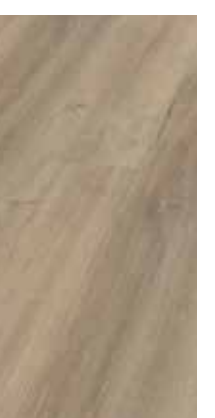
6131 Eiche Grigio