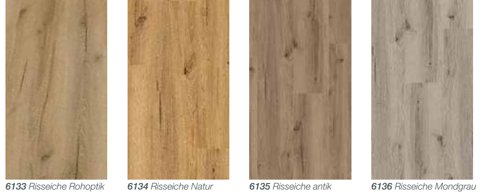
6133 Risseiche Rohoptik 6134 Risseiche Natur 6135 Risseiche antik 6136 Risseiche Mondgrau

Nicht mehr von echter Eiche zu unterscheiden!