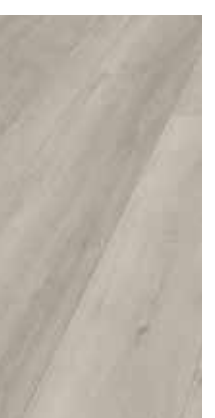
6130 Eiche Basalt