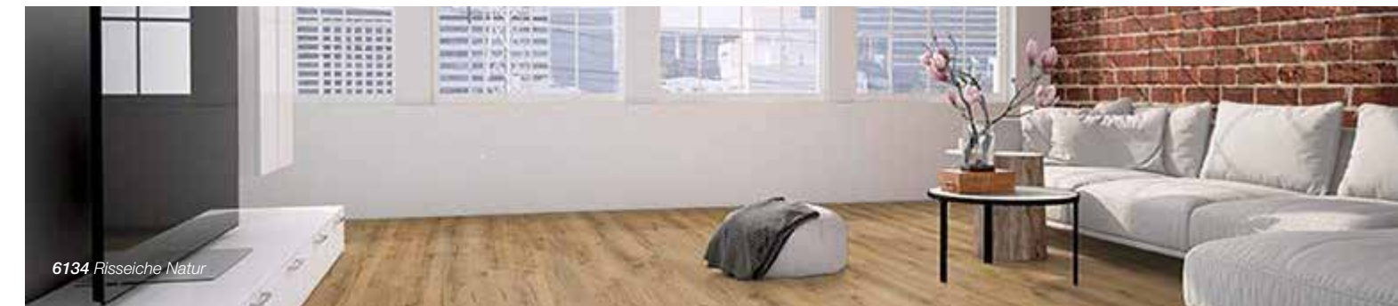
6134 Risseiche Natur

Jedes Astloch, jeder Riss, jede Erhebung und kleine Furche und Rille wird sanft genau dort geprägt, wo sie auch zu sehen ist. Die sogenannte Synchronprägung ist die nächste Stufe der Vinylprägung. Durch diese anspruchsvolle Technik sind softsynchron-geprägte Vinylböden auch haptisch kaum mehr von echtem Holz zu unterscheiden, sie wirken außergewöhnlich naturnah und unverfälscht.