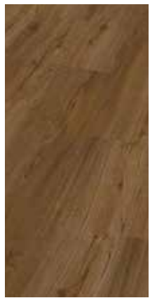
6024 Eiche Maive