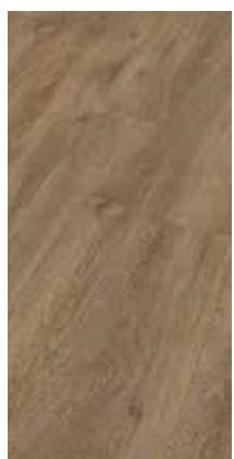
6041 Eiche Olive