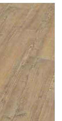
6046 Eiche Stream