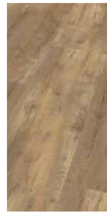
6022 Eiche Hasel