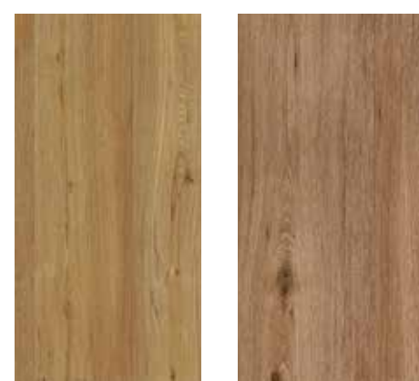
6092 Eiche Rustik XXL 6094 Ossereiche XXL