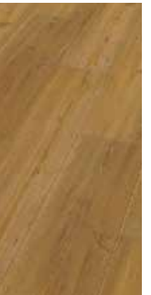
6031 Eiche Azalea