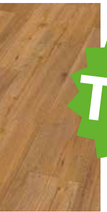
6027 Eiche Linea