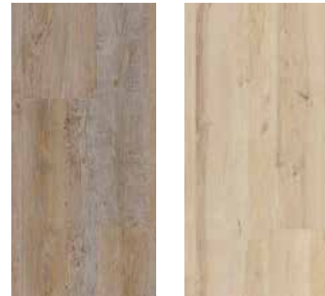
6122 Fichte Pasadena 6124 Birke Portland