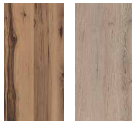
6007 Granatapfel 6008 Samteiche