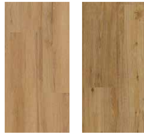
6000 Alpineiche 6001 Eiche Rustik