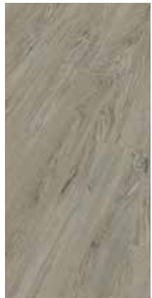
6029 Eiche Yola