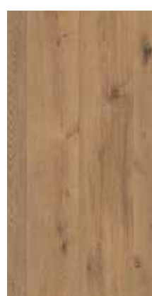
6102 Eiche Elsäss XXL