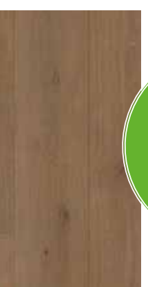
6291 Eiche Schoki XXL