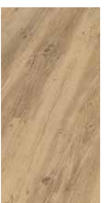
6052 Eiche Melange