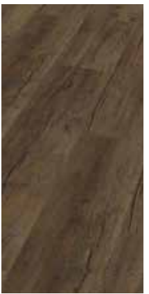
6025 Eiche Myrte