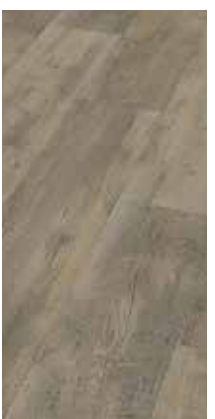
6042 Eiche Hasel grau