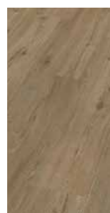
6047 Eiche Cream