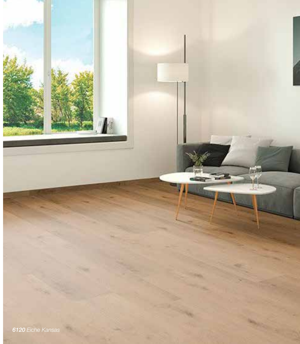
6120 Eiche Kansas

58 Designs 10 Ausführungen 100 Varianten