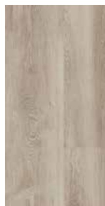
6127 Eiche Hamptons

Ob hell, dunkel, trendy oder zeitlos klassisch – Vinylböden lassen keine Wünsche offen. Sie lassen sich toll kombinieren, auf verschiedenste Arten gestalten und lassen Ihrer Fantasie freien Raum!