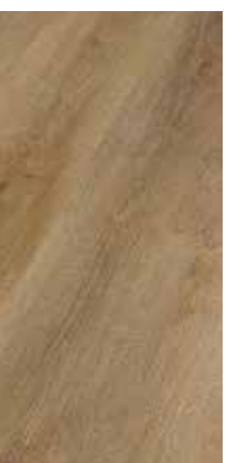
6288 Eiche Mojave XL