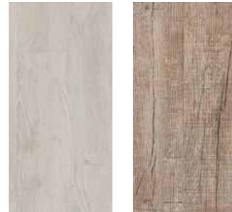
6002 Schneeeiche 6003 Eiche Stonehenge