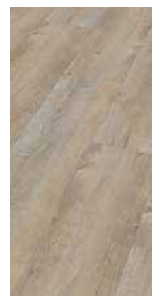
6040 Antikfichte crema