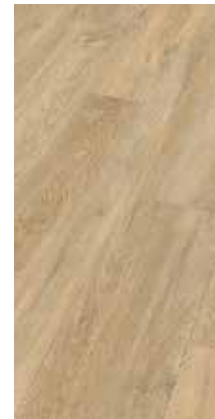
6028 Eiche Ginger