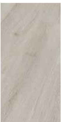
6287 Eiche Karakum XL