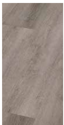
6286 Eiche Gobi XL