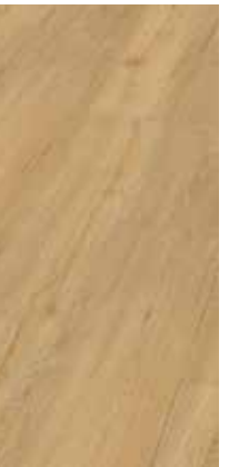
6034 Eiche Carmella