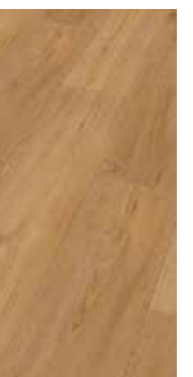
6045 Eiche Natur