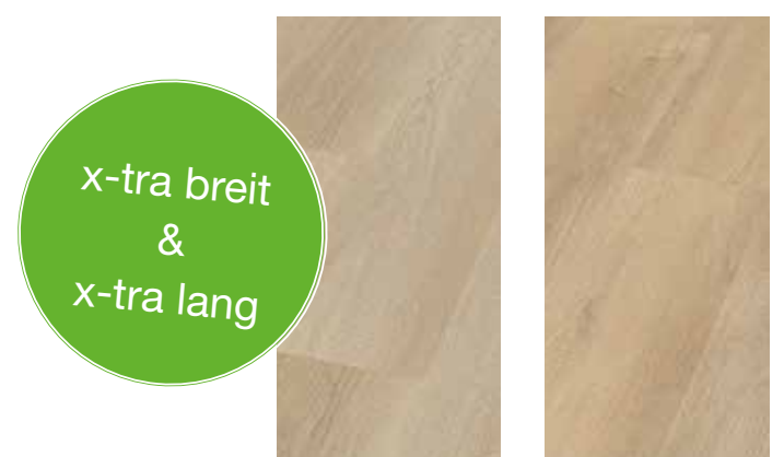
6289 Eiche Patagonia XL 6290 Eiche Victoria XL