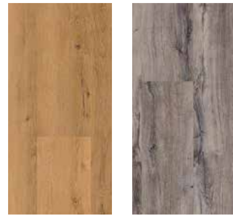
6120 Eiche Kansas 6121 Eiche Daytona

Unsere Spitzenreiter für den kleinen Geldbeutel!