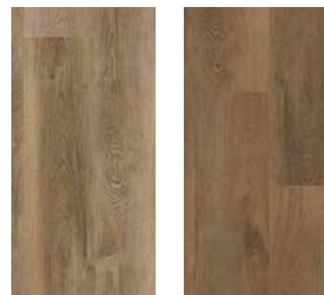
6125 Eiche Aspen 6126 Eiche Dallas