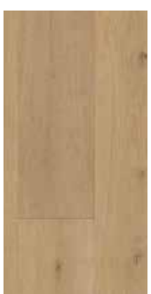
6285 Eiche Vanilla XXL