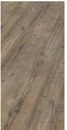
6030 Eiche Stahl